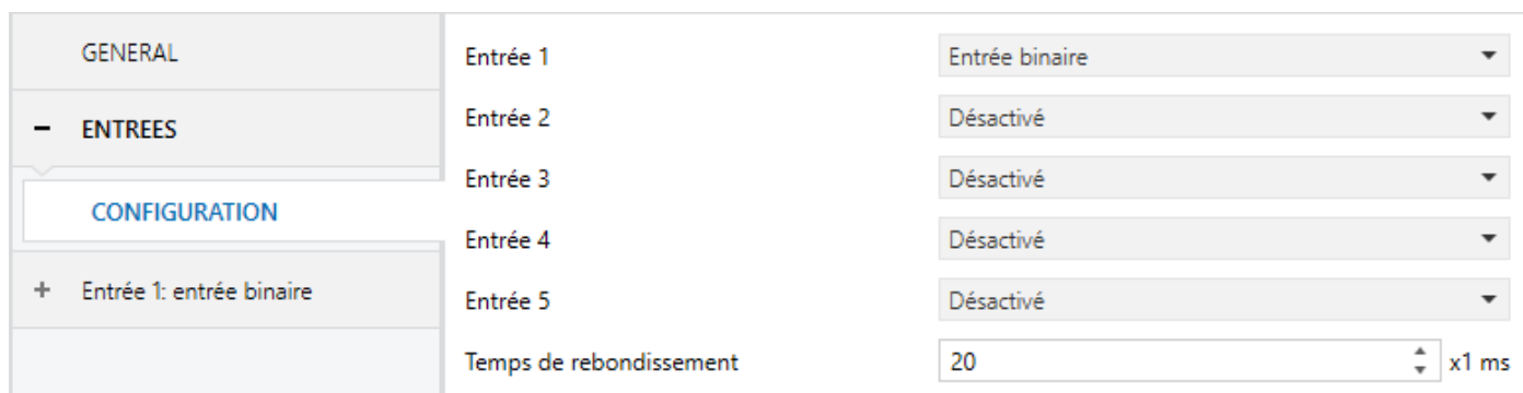
Figure 1. Activation du module d'entrée binaire.

Le programme d'application proportionnera typiquement une case pour chaque entrée, de manière qu'il soit possible de les habiliter comme entrée binaire de forme indépendante. S'il vous plaît, consultez le manuel spécifique du programme d'application pour identifier ou se trouvent ces cases.